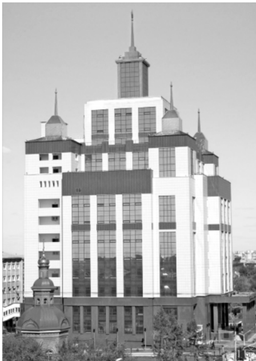
Здание научной библиотеки Оренбургского государственного университета