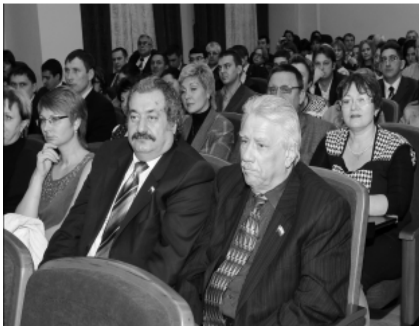
Представители научной общественности Оренбуржья в ОГУ. 10 февраля 2011 г.

Это позволяет нам с оптимизмом смотреть в будущее!